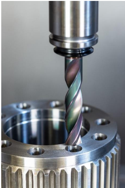
Bild 1: Mit seiner materialspezifischen Optimierung erreicht der EMUGE SteelDrill mit maximalen Vorschüben ein Höchstmaß an Performance.